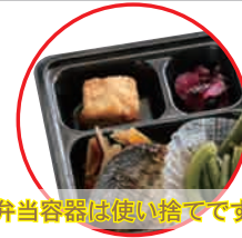
お弁当容器は使い捨てです。