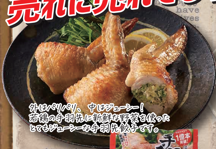
外はパリパリ、中はジューシー！ 若鶏の手羽先に新鮮な野菜を使った とてもジューシーな手羽先餃子です。

若鶏の手羽先にこだわりの 無着色明太子使用し中にとび込めました。 鶏肉のジューシーな肉汁と 明太子の旨みがマッチ！